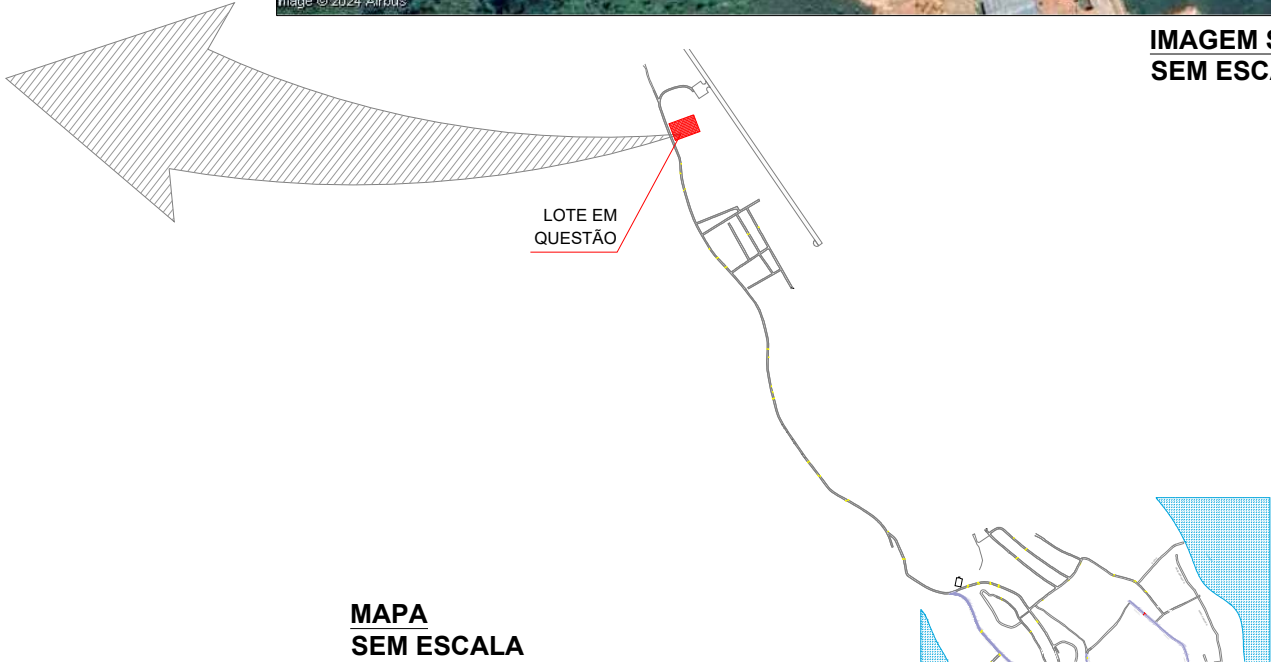
MAPA SEM ESCALA

PROJETO ESTRUTURAÇÃO DA REDE DE SERVIÇOS DO SISTEMA ÚNICO DE ASSISTÊNCIA SOCIAL - SUAS - CONSTRUÇÃO DE CENTRO DE REFERÊNCIA ESPECIALIZADO DE ASSISTÊNCIA SOCIAL - CREAS