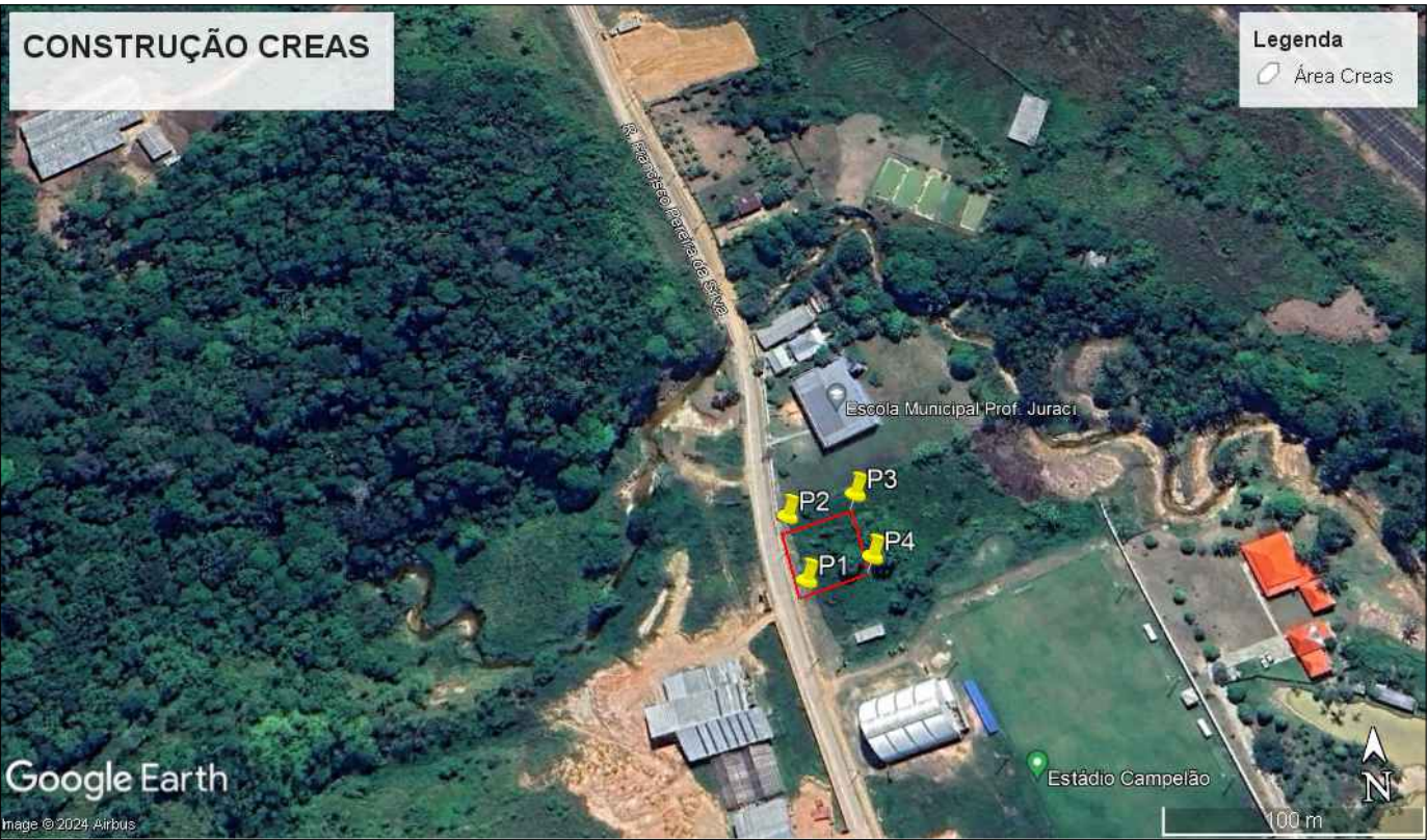
IMAGEM SATÉLITE - SITUAÇÃO SEM ESCALA